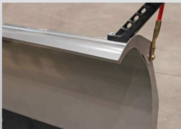
Stahl-Schneeabweiser für Gerade-Pflug (optional)